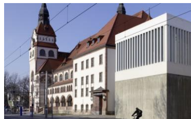
KONGRESSHALLE am Zoo Leipzig