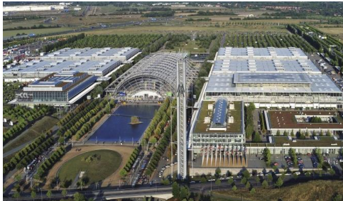
Messehalle 1 - 5 und Freigelände