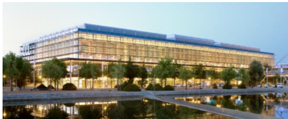
Congress Center Leipzig